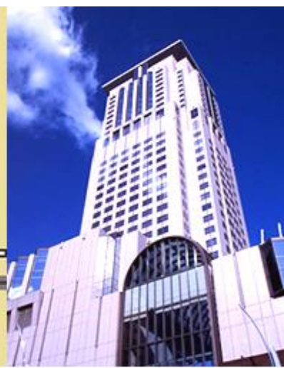
大阪梅田キャンパス(アプローズタワー14階)