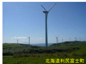
北海道利尻富士町

(背景は、日本大学生物資源科学部60周年記念事業として制定された、生物資源科学部の新しいロゴマークです。)