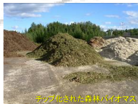
チップ化された森林バイオマス