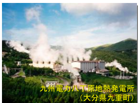
九州電力八幡地熱発電所 (大分県九重町)