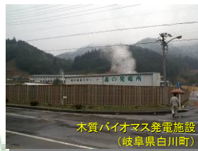
木質バイオマス発電施設 (岐阜県白川町)