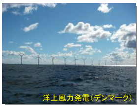
洋上風力発電(デンマーク)