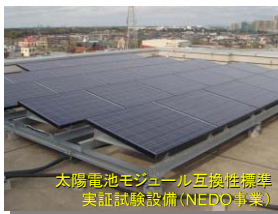
太陽電池モジュール互換性標準 実証試験設備(NEDO事業)