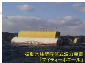
振動水柱型浮体式波力発電 「マイティール」